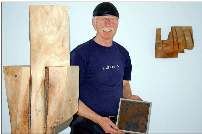
Holzskulpturen, Reliefs und Druckgrafik – Loth schätzt alle Dimensionen.

Maurits Cornelis Escher. Der Versuch, eine Skulptur von Loth zu durchschauen, endet manchmal nicht anders wie der Versuch, einen Escher zu enträtseln.