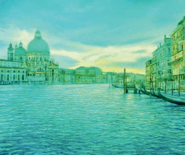
Venedig 24, 2013, Öl/Lw. 100 x 120 cm