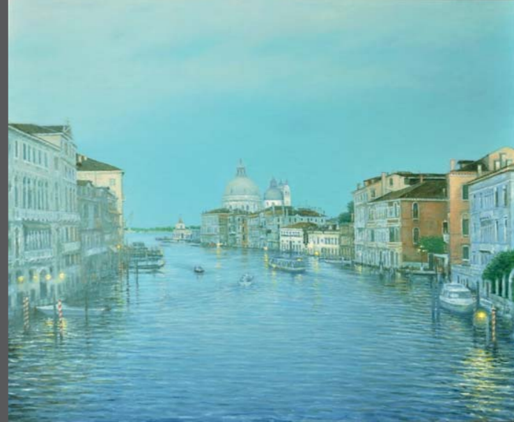
Venedig 13, 2013, Öl/Lw. 130 x 150 cm