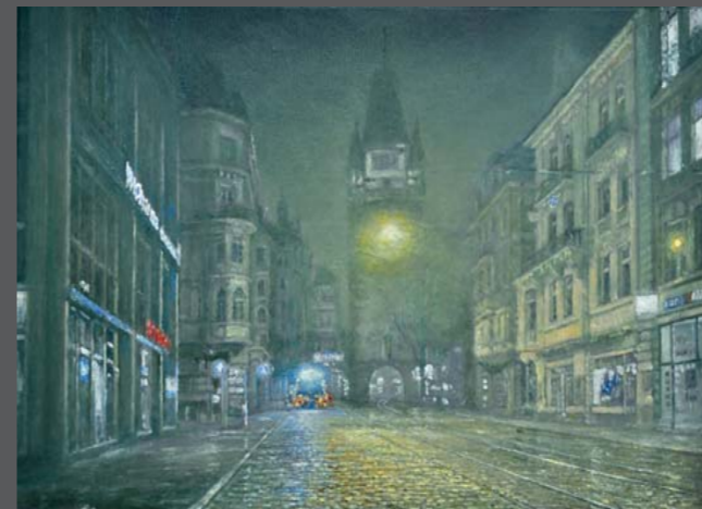
Martinstor , 2014, Öl/Lw. 40 x 60 cm