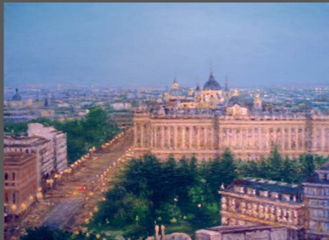
Madrid (Palacio Real) , 2009, Öl/Lw. 30 x 40 cm

Umschlag: Nachtbild , 2012, Öl/Lw. 177 x 196 cm