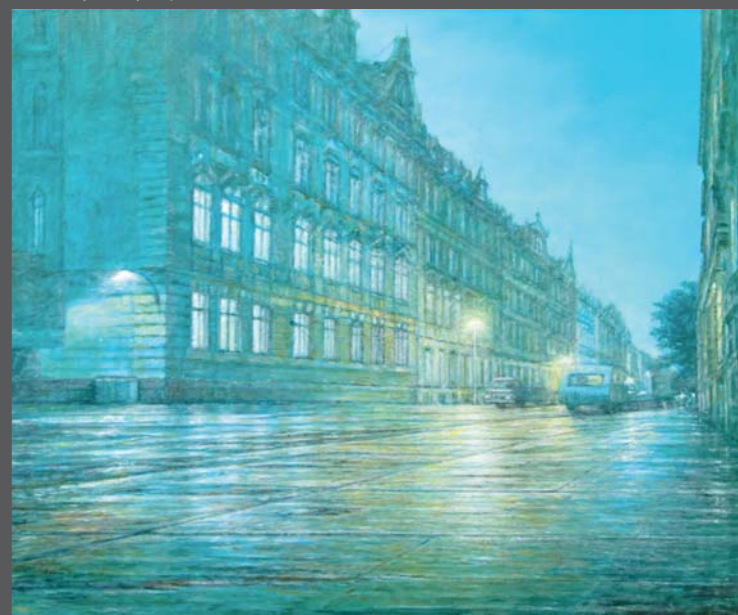
Dresden, 2013, Öl/Lw. 100 x 120 cm