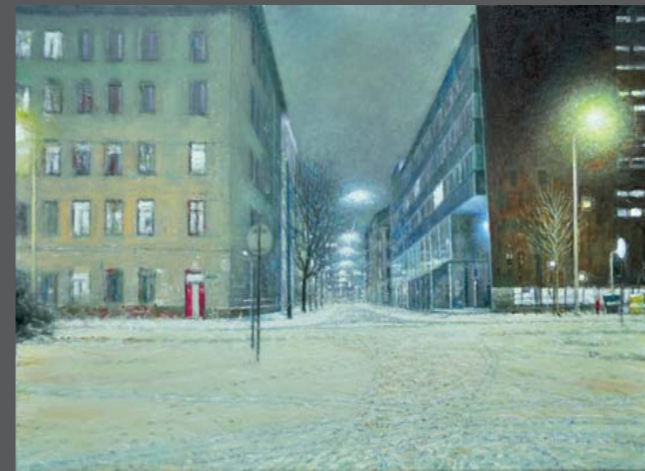
Berlin , 2013, Öl/Lw. 40 x 60 cm