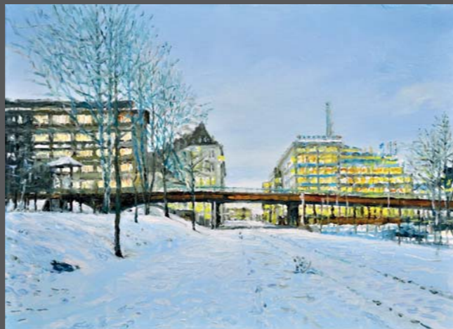
Hafenweg , 2013, Öl/Lw. 30 x 40 cm