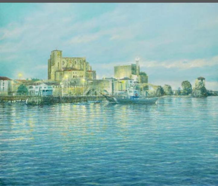
Castro Urdiales, 2013, Öl/Lw. 120 x 150 cm