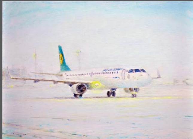
Aeropuerto (Lufthansa) , 2013, Öl/Lw. 30 x 40 cm