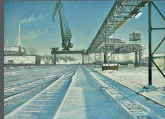
Chalampé 2 , 2013, Öl/Lw. 40 x 60 cm