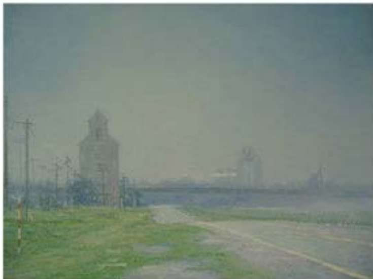
Lexington II , 2004, Öl auf Leinwand, 30 x 40 cm