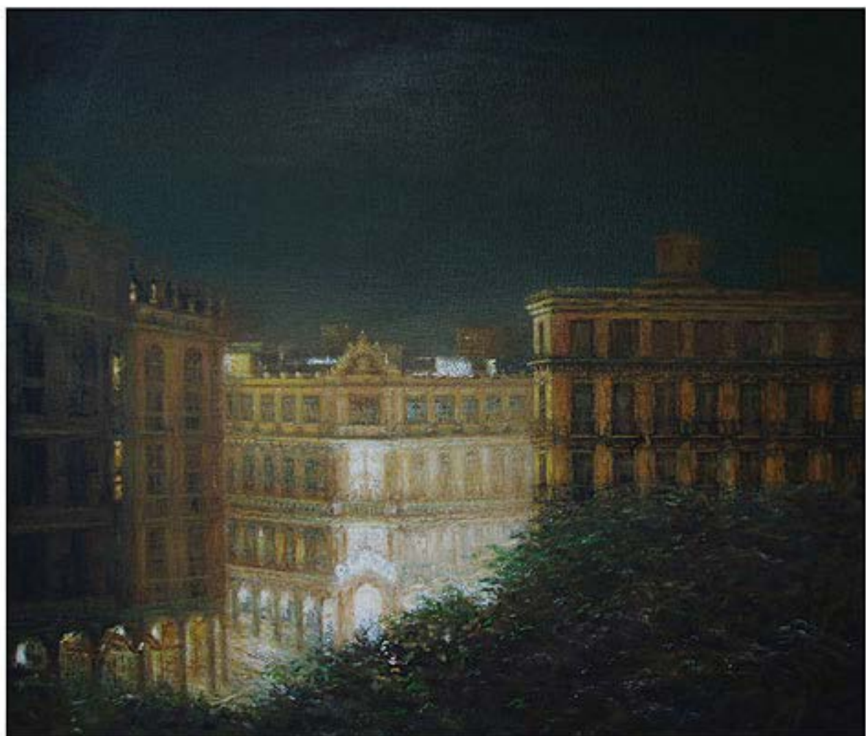
La Habana VIII , 2003, Öl auf Leinwand, 130 x 150 cm