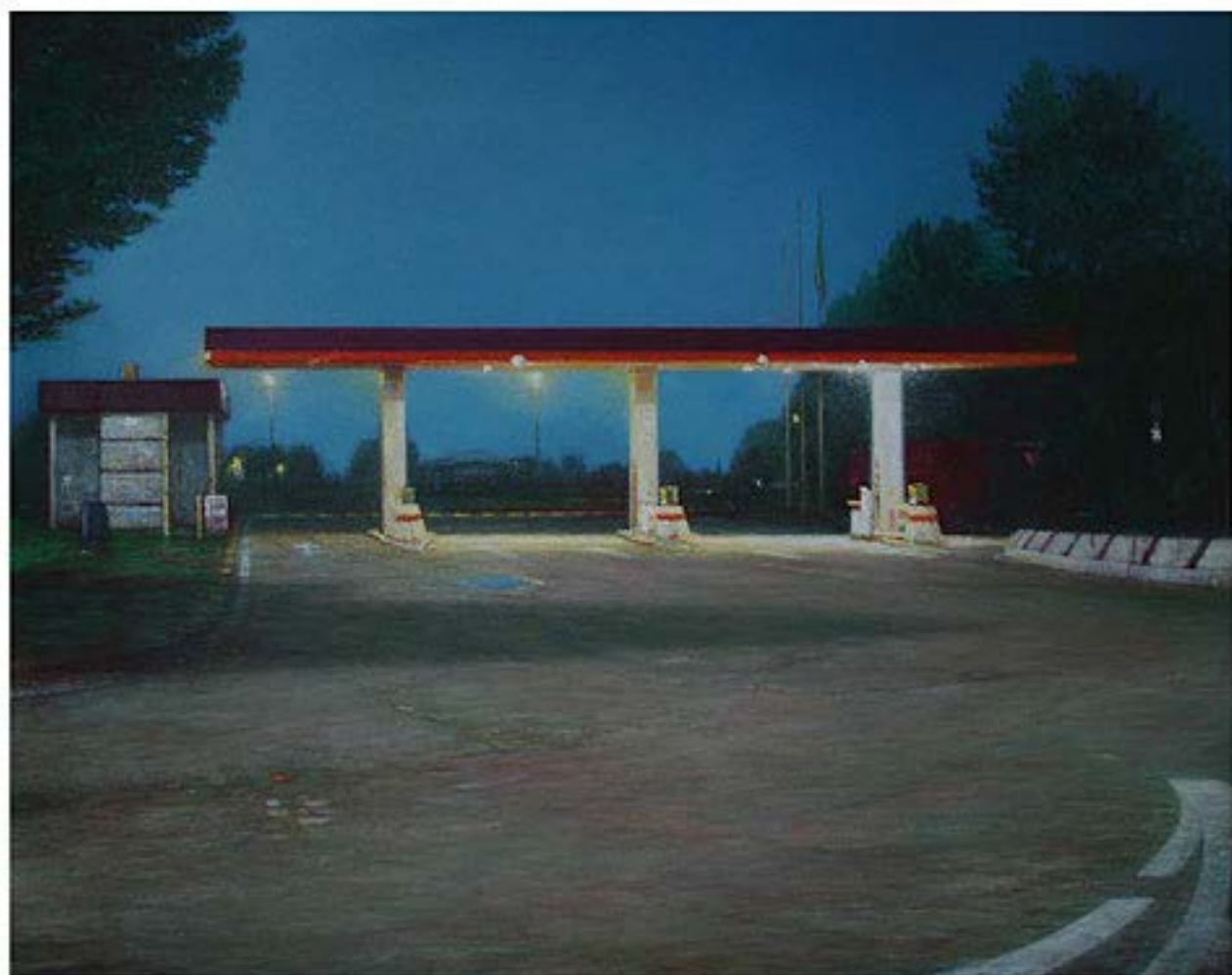
Mautstation, 2004, Öl auf Leinwand, 120 x 150 cm