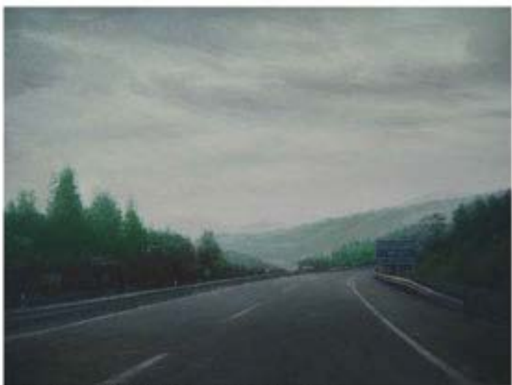
Coadonga , 2004, Öl auf Leinwand, 30 x 40 cm