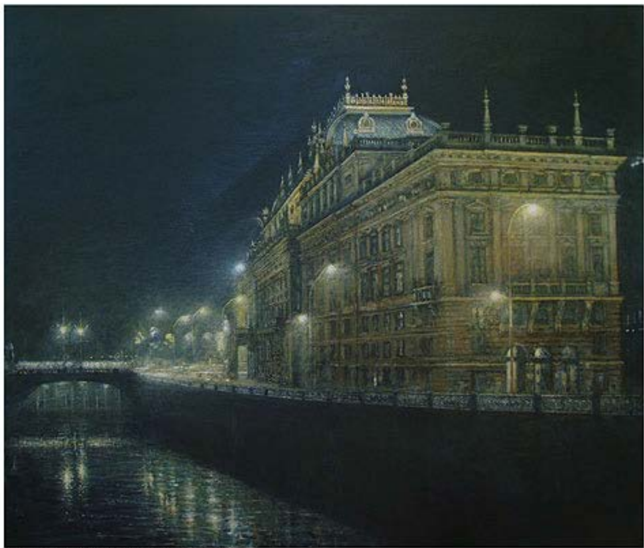
Praga, 2004, Öl auf Leinwand, 130 x 150 cm