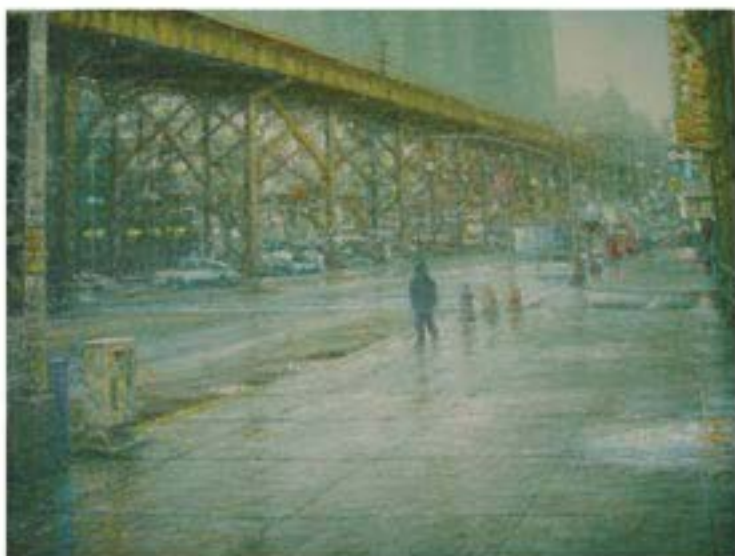
Szpilman in NY , 2006, Öl auf Leinwand, 30 x 40 cm