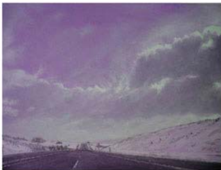
Perouse , 2005, Öl auf Leinwand, 30 x 40 cm