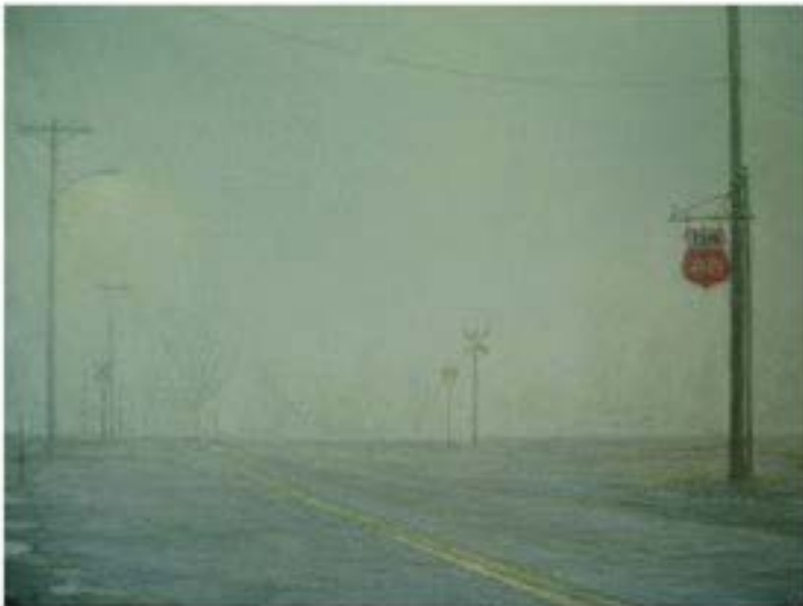
Pili 66 , 2004, Öl auf Leinwand, 30 x 40 cm