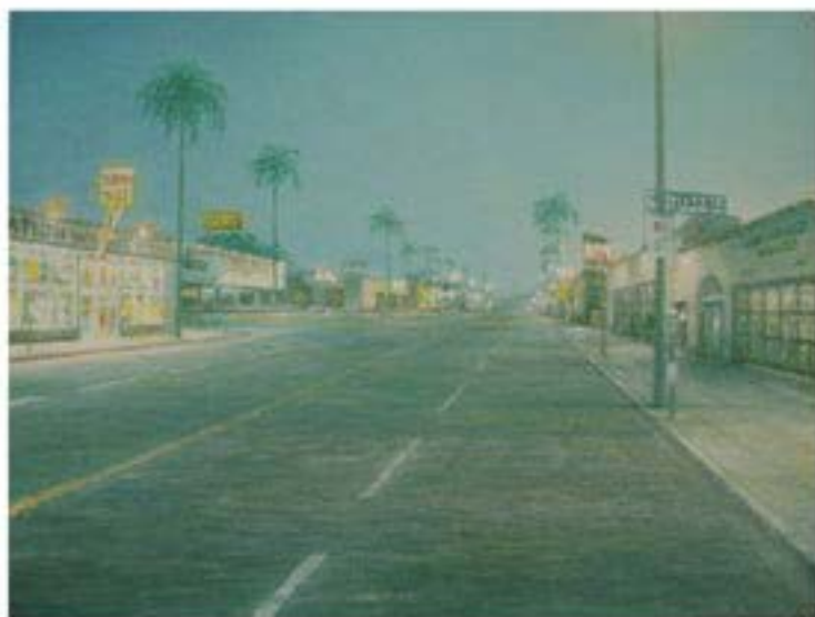
Garp , 2005, Öl auf Leinwand, 30 x 40 cm