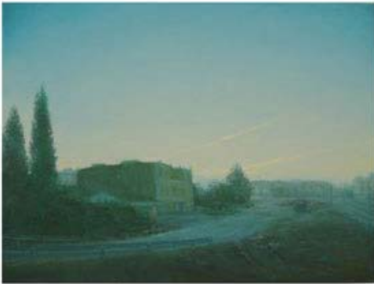
El Berrón VI , 2005, Öl auf Leinwand, 30 x 40 cm