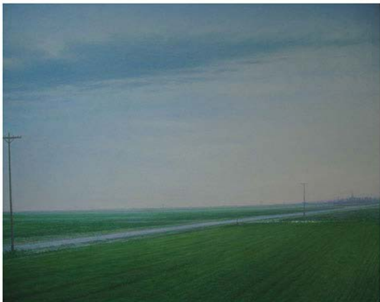
Tordesillas , 2006, Öl auf Leinwand, 120 x 150 cm