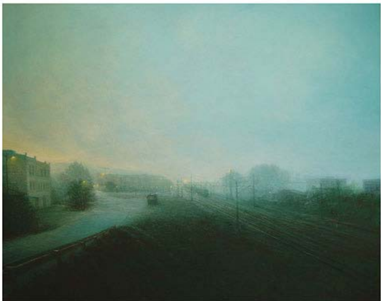
El Berrón III , 2005, Öl auf Leinwand, 120 x 150 cm