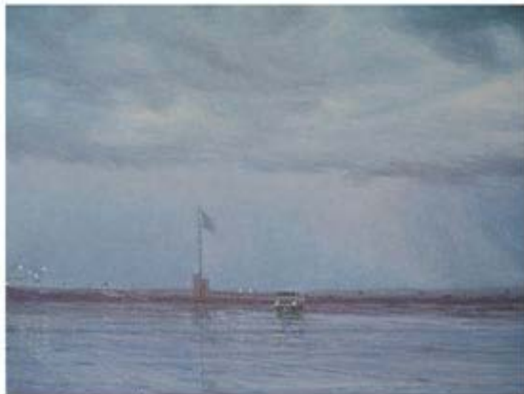
Holbrook , 2004, Öl auf Leinwand, 30 x 40 cm