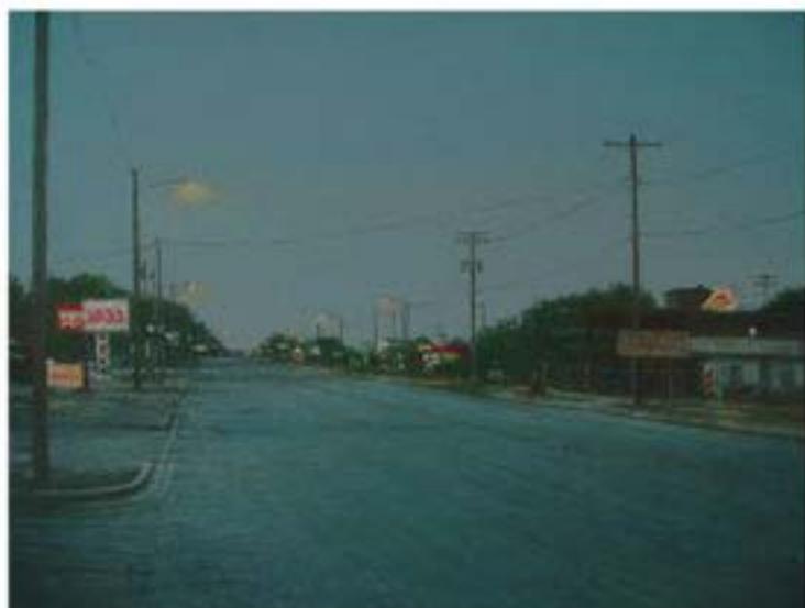
Leal, 2004, Öl auf Leinwand, 30 x 40 cm