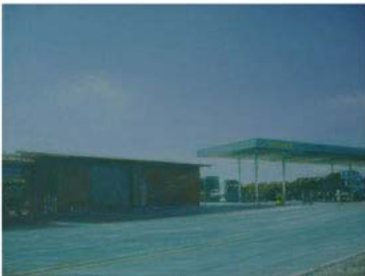
Wikc.en , 2006, Öl auf Leinwand, 30 x 40 cm

Verso a verso, paso a paso, se hace camino al andar