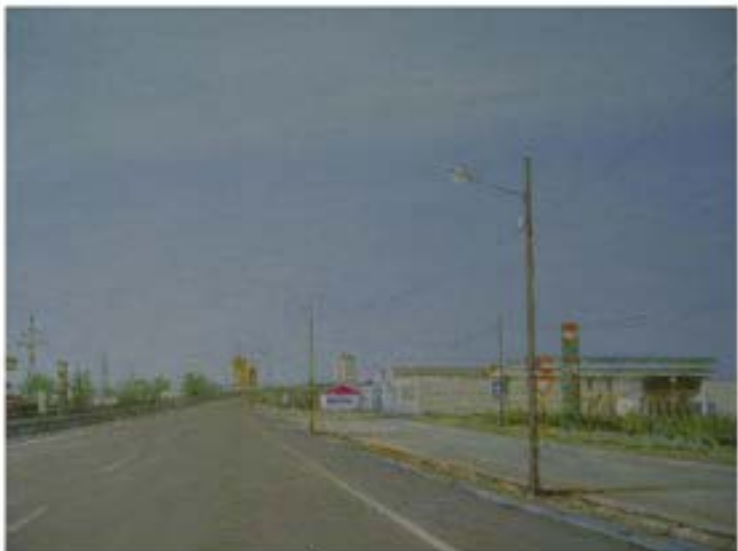
Carrión de los Condes , 2004, Öl auf Leinwand, 30 x 40 cm