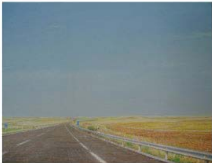
Mesilla de las Mulas , 2004, Öl auf Leinwand, 30 x 40 cm