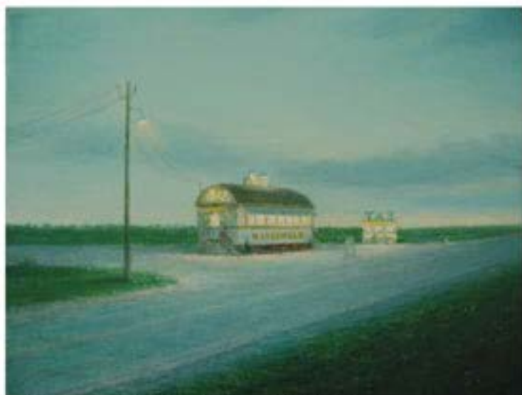
Woodengle 1 , 2006, Öl auf Leinwand, 30 x 40 cm