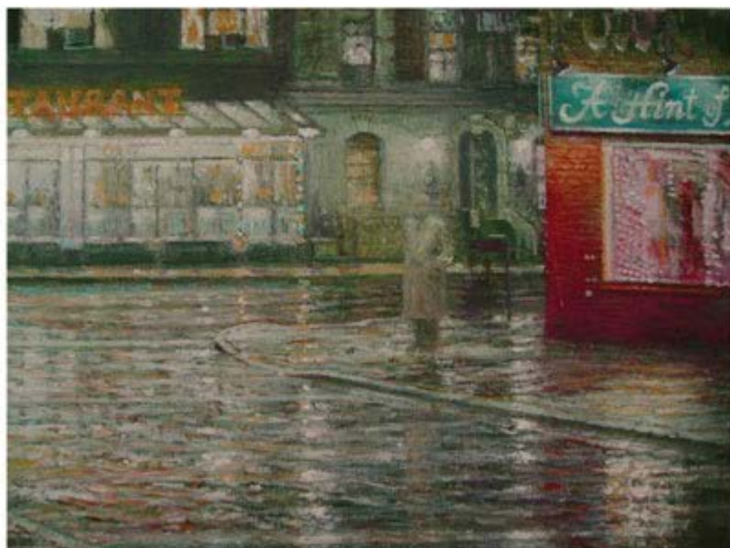
Eyes wide shut 2 , 2005, Öl auf Leinwand, 30 x 40 cm, Privatbesitz