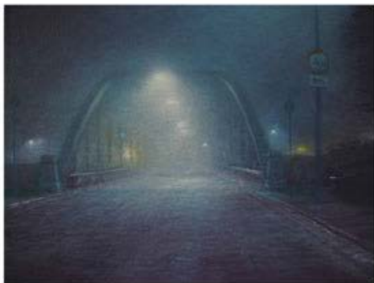
Kaiserstuhlbrücke, 2005, Öl auf Leinwand, 30 x 40 cm