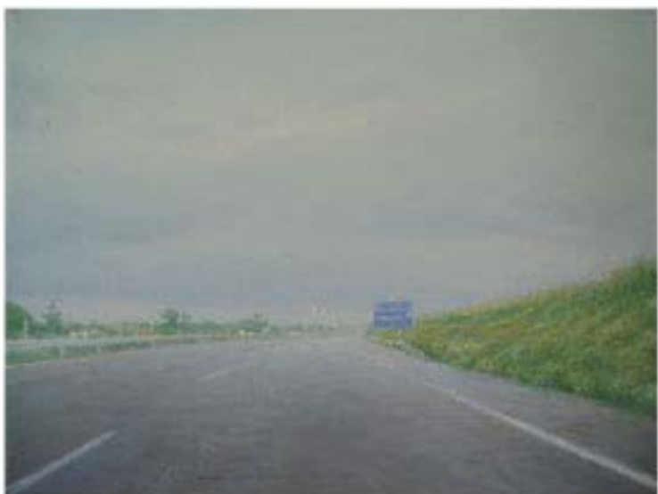
Naves , 2004, Öl auf Leinwand, 30 x 40 cm