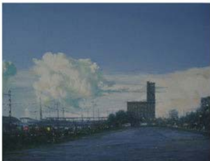
Kegan 2 , 2005, Öl auf Leinwand, 30 x 40 cm