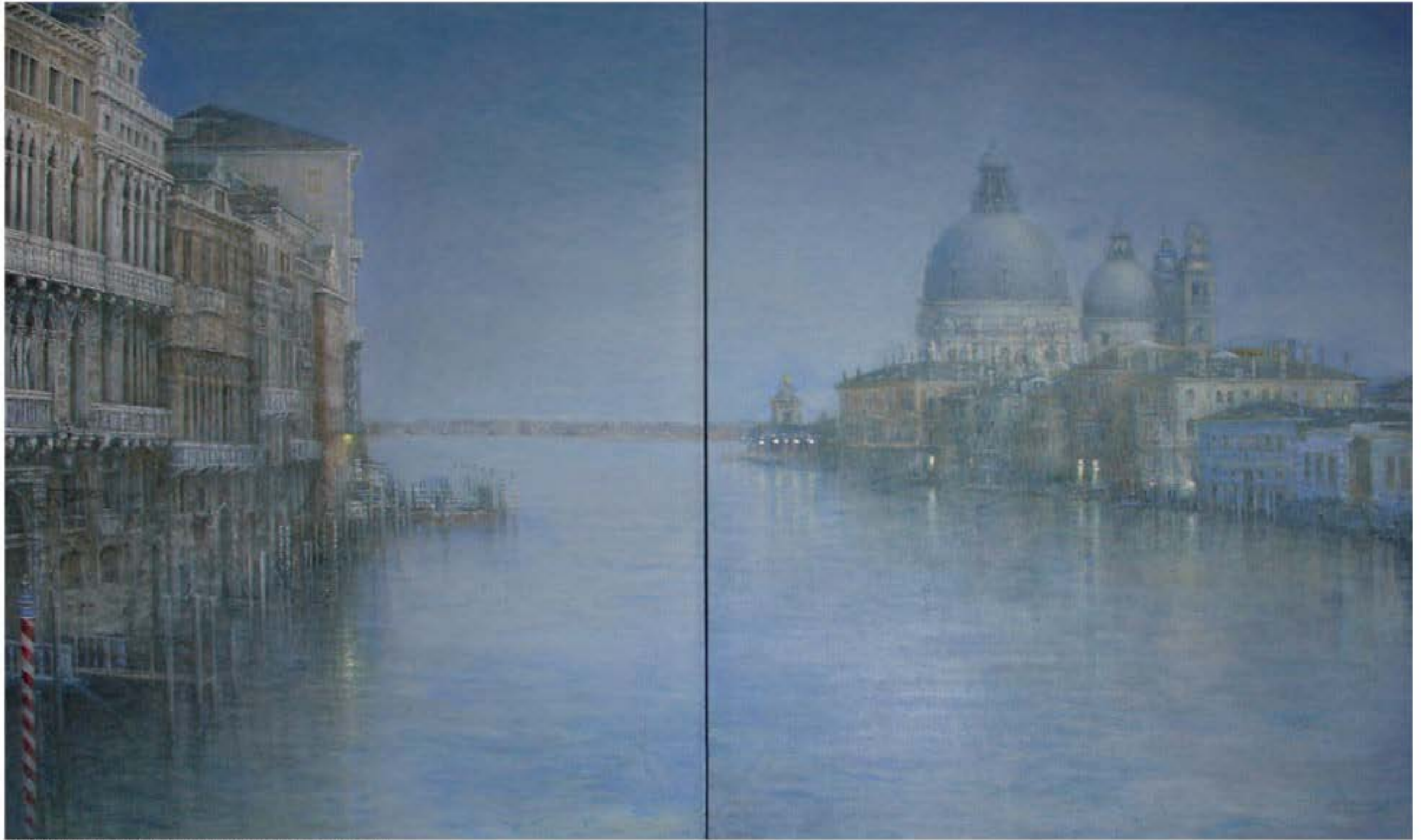
Venedig VII, VIII, 2003, Öl auf Leinwand, 120 x 210 cm, Privatbesitz