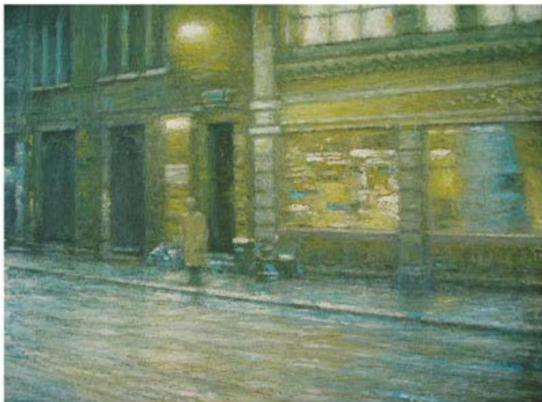
Eyes wide shut 1 , 2005, Öl auf Leinwand, 30 x 40 cm, Privatbesitz