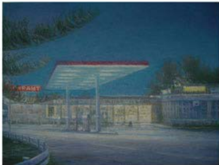
Wind up workin' in a gas station, 2006, Öl auf Leinwand, 30 x 40 cm