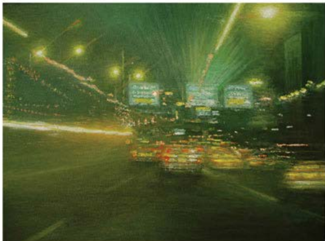
Corbis, 2005, Öl auf Leinwand, 30 x 40 cm